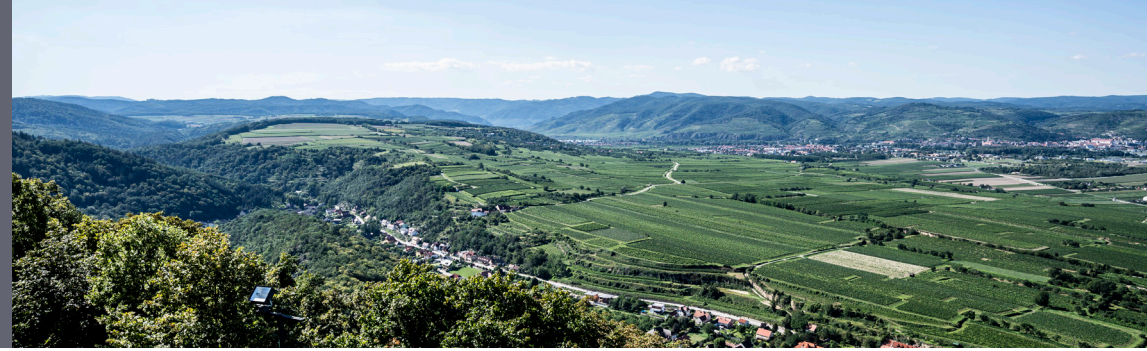
Aussicht auf die Donau

INMITTEN DER NATUR GELEGEN, RUND 15 AUTO-MINUTEN VON DER KULTURSTADT KREMS ENTFERNT, BIETEN 5 MODERNE TINY-HÄUSER SINGLES, PAAREN UND AKTIVEN SENIOREN EIN WOHLIGES ZUHAUSE.